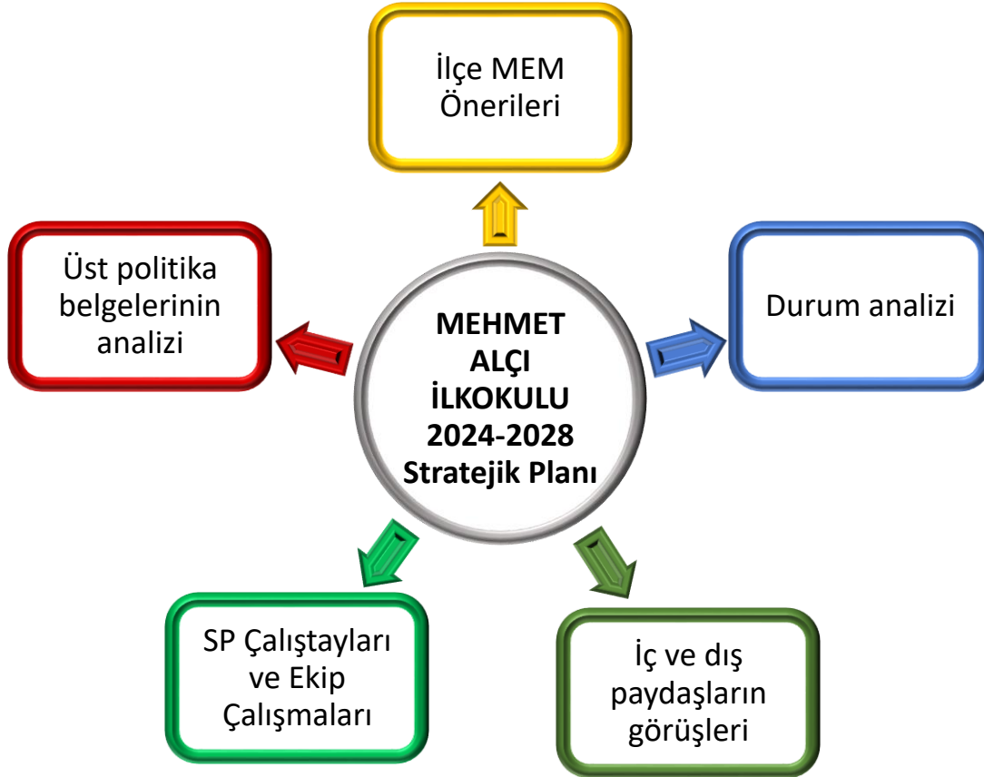
Şekil 1: Stratejik Plan Oluşum Şeması

Okul/Kurum Stratejik Planlama Ekibi: Okul müdürü tarafından görevlendirilen ve üst kurul üyesi olmayan müdür yardımcısı başkanlığında, okul/kurumun büyüklüğü ve şartları doğrultusunda öğretmenler ve gönüllü velilerden oluşur.